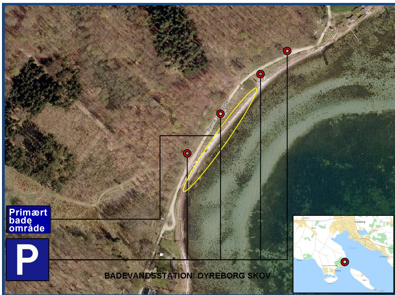
Figur 2: Badestedet med diverse informationer.

Vanddybden er efter ca. 90 meter omkring 1,5 meter.