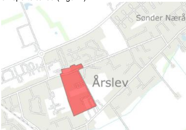
Figur 1: Området i Årslev Bymidte, hvor spildevandsplanen ændres.

Der har været afholdt en arkitektkonkurrence og vinderforslaget er skrevet ind i en ny lokalplan for området. Lokalplanen giver mulighed for etablering af cirka 35 boliger, samt etablering af en sportsfælled (Figur 1).