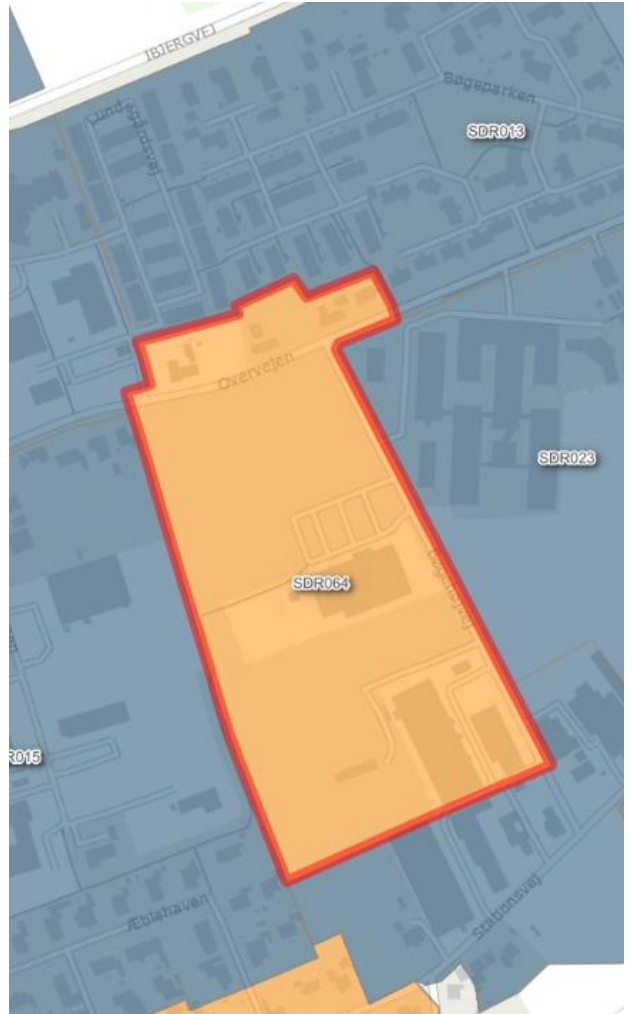
Figur 2: Området i Årslev Bymidte før ændringen af spildevandsplanen. Området er markeret med rødt.

Området er i dag optaget i spildevandsplanen 1 som fælleskloakeret (Figur 2).