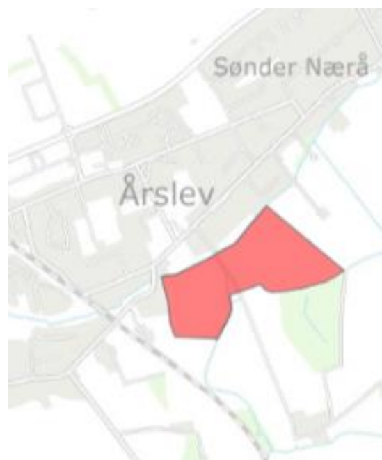
Figur 4: Området syd for Årslev og Vindinge Å som planlægges til byudvikling. Området bliver separatkloakeret.

Området bliver separatkloakeret og bliver registreret som kloakopland SDR067 i spildevandsplanen.