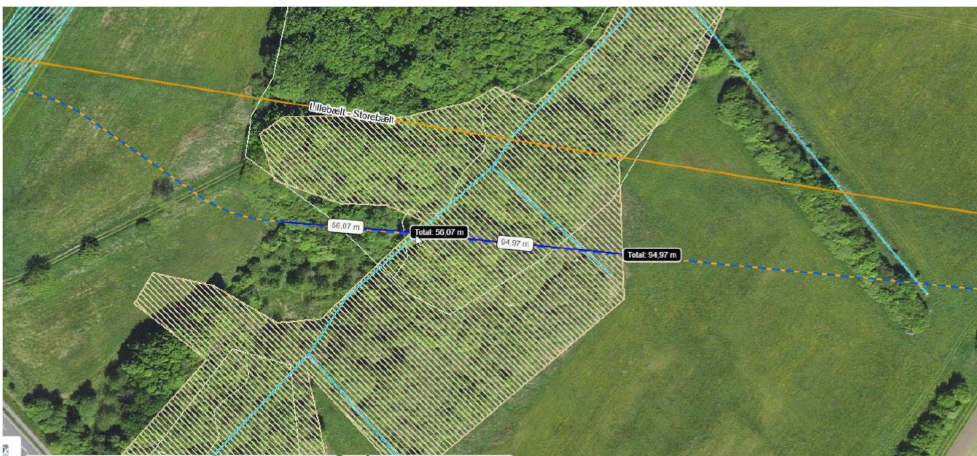
Figur 2 Krydsningspunkt i Lindved Å (stiplet linje). Skraveret areal er beskyttet mose. Udsnit er fra Faaborg-Midtfyn Kommunes tilladelse af 16. marts 2020.