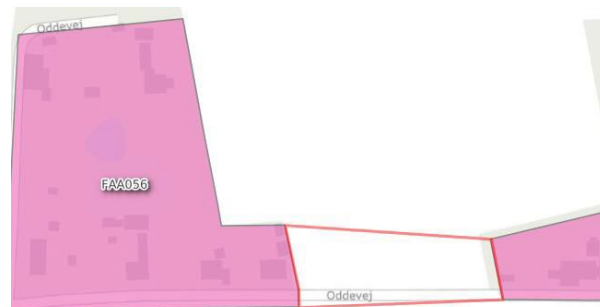
Figur 1: Før opdatering

Projektet finansieres af FFV gennem spildevandstaksterne 2 .