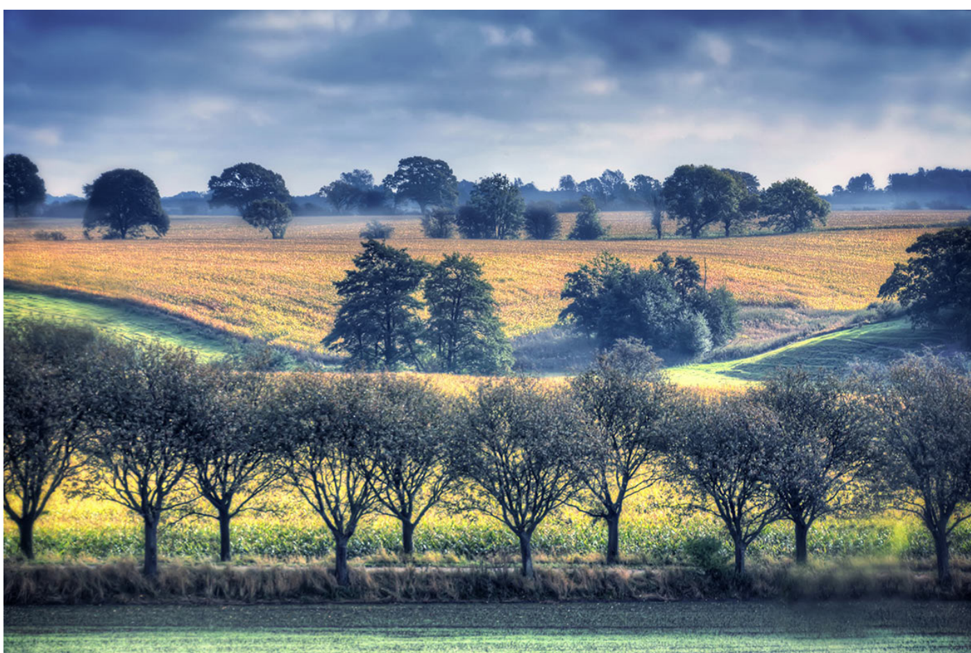
Gislevs omkringliggende landskab. I forgrunden ses en række allétræer, som er karakteristisk for de fynske herregårdslandskaber.

Gislev er placeret landskabeligt på toppen af den nordlige dalside af Kongshøj Å tunneldal og nyder godt af store rekreative arealer ved ådalen, hvor det vigtige samlingspunkt Ådalsscenen også ligger. Store dele af Kongshøj Å tunneldal består i dag af beskyttede naturtyper, desværre er der ringe adgang til disse via Gislev og landskabskvaliteterne opleves ikke, når man bevæger sig ad hovedgaden gennem byen.