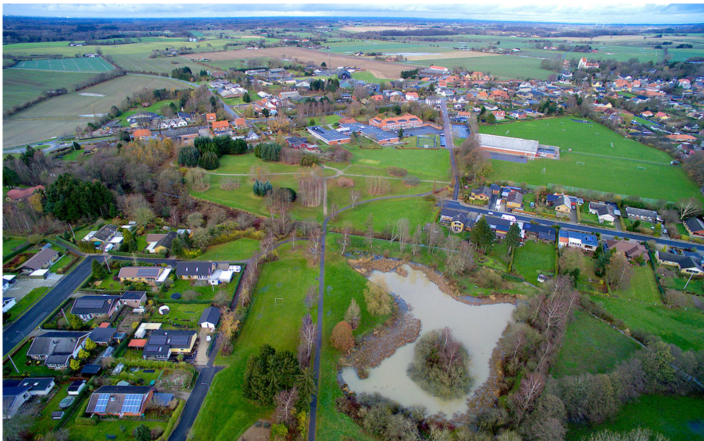
'Børneskoven' i Gislev , hvor Ådalscenen ligger placeret idag

Stikord: Ådalscenen, Fællesskab, musik, kultur, natur, markveje, stier, velfærdsby, friskoler, Grundtvig og Christen Kold, altid liv og glade dage på fodboldbanerne, sammenhold og fælles gåture, ildsjæle, foreningsliv, engagement, frivillighed