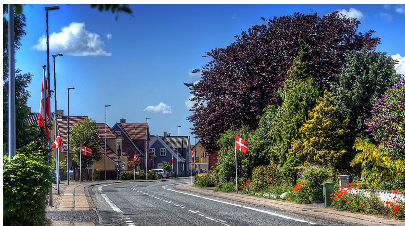
Forskellige dele af vejforløbet i Gislev. En dag med Flagallén opsat til markering af mærkedag i byen.

Under områdefornyelsen er der bl.a. planer om at styrke området omkring SuperBrugsen og by-ens lille torv, med bedre muligheder for ophold, formidling om området og sæsonbetonet beplantning. Derudover skal der plantes træer flere steder og byportene markeres med blomsterløg og/- eller træer. Gislev har en smal vejprofil, og derfor har det i Områdefornyelsen været en udfordring af finde fysisk plads til projekterne langs vejen. Flere projekter laves derfor på kommunale matrikler og afhænger ellers af velvilje fra de lokale lodsejere