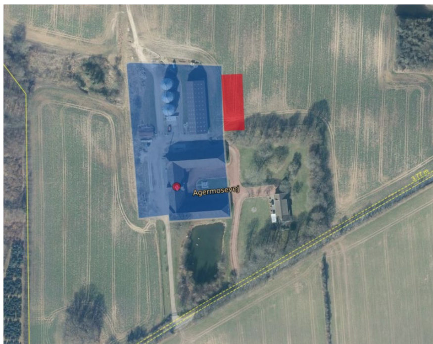
Det V1-kortlagte område angivet med blå markering, ridebanen med rød markering.

Ejendommen er delvist kortlagt som forurenede på vidensniveau 1 (V1). Det betyder, at der er tilvejebragt en faktisk viden om aktiviteter på arealet eller aktiviteter på andre arealer, der kan have været kilde til jordforurening på arealet.