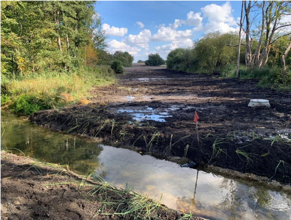
Figur 5 Udløb af ny rørledning i Lindved Å