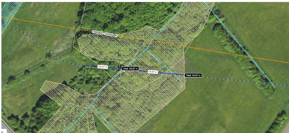
Figur 2 Krydsningspunkt i Lindved Å (stiplet linje). Skraveret areal er beskyttet mose. Udsnit er fra Faaborg-Midtfyn Kommunes tilladelse af 16. marts 2020.