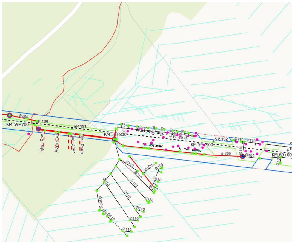
Figur 4 Dræn- og rørledninger i beskyttet mose på matrikel nr. 1b Bramstrup Hdg., Nr. Lyndelse (tyk rød linje er tætte rørledninger, tynde sorte linjer er dræn, blå cirkler med rød ring er brønde, stiplede sorte linjer er gasledningen)

I forbindelse med etablering af kørevej og selve udgravningen er den eksisterende hovedledning/ grøft omlagt til et fast PVC-rør og bragt til udløb i Lindved Å i opstrøms ende af ledningstraceet. Selve hovedledningen er udført i dimensionen Ø250 PVC. Omlægningen blev udført for at undgå beskadigelse af rørledningen i selve anlægsperioden, men også for at undgå efterfølgende skader og driftsproblemer i forbindelse med de forventede sætninger der formodes, at ville opstå i de tilbagelagte jordlag, der hovedsagligt udgøres af gytje.