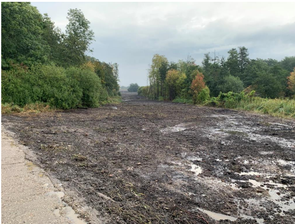
Figur 1 Gasledningens tracé på matrikel nr. 1b og 1h Bramstrup Hdg., Nr. Lyndelse

Etablering af gasledningen har betydet en krydsning af det offentlige vandløb Lindved Å som er omfattet af naturbeskyttelseslovens § 3 og en reetablering af de eksisterende drænsystemer som er berørt af projektet.