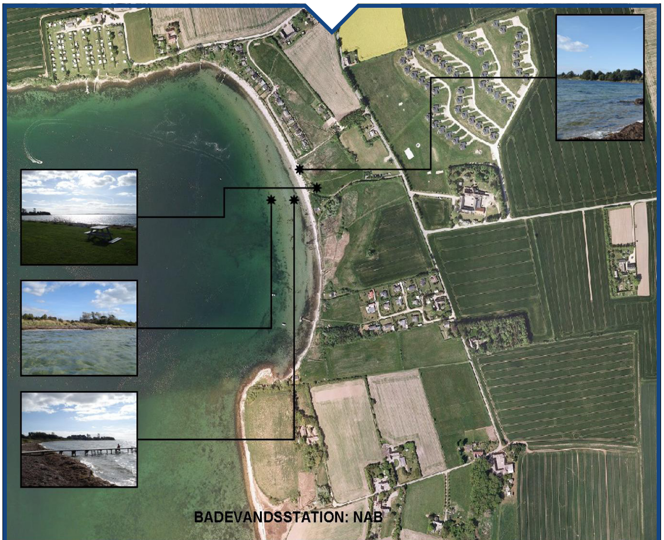
Figur 1: Badestedets placering med billeder taget på badestedet i september 2010.