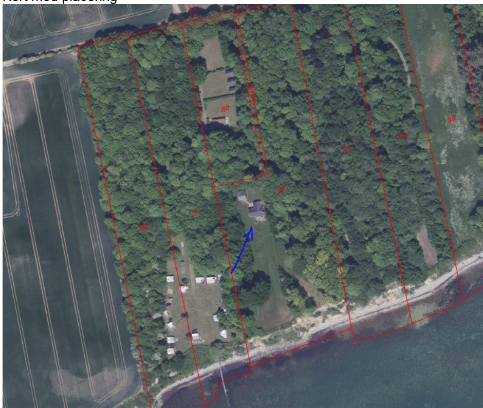
Ejendommen ved blå pil