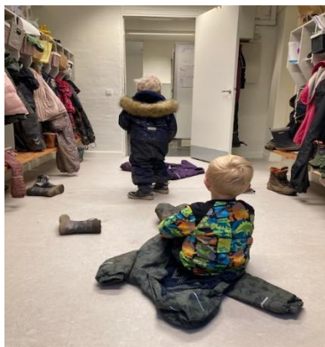
Miniprojekt formidles på husmøder.

August-oktober 2021 fokus på krop, sanser og bevægelse. Garderoben. Børns selvhjulpenhed. se Side 36 i PLP.