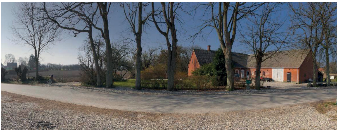
Området set mod sydvest over Hovedvejen

I kraft af de væsentlige forbedringer der er sket i Natura 2000-området Vestlige del af Avernakø for Klokkefrø er de fredede vandhuller centralt beliggende på Avernakø ikke længere primære ynglelokaliteter, men fungerer stadig som raste- og fourageringsområder for klokkefrø. Dette er senest blevet bekræftet i NOVANA-overvågningen fra 2021, hvor der ikke blev fundet yngleaktivitet i de fredede vandhuller nær det planlagte område. Vandhullerne fungerer dog stadig som rasteområde for klokkefrø og i kraft af at bestanden af klokkefrø vurderes til at være stabil eller i fremgang må det også forventes, at der er i og omkring det planlagte område kan være overvintrende klokkefrøer. Klokkefrøer overvintrer gerne i udhuse, under bygninger og i sten- og jorddiger, kvas-