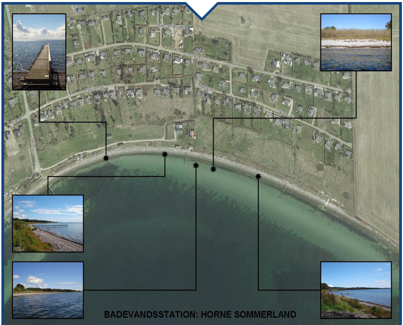
Figur 1: Badestedets placering med billeder taget på badestedet i september 2010.