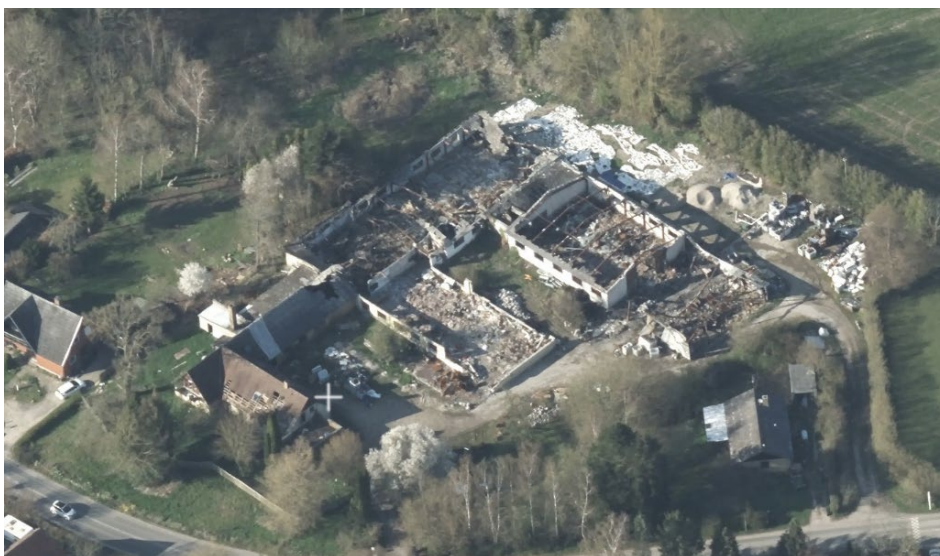
Skråfoto, der viser den nedbrændte bygningsmasse

Du har søgt om tilladelse til at opføre en ny værksteds-/lagerbygning på ca. 400 m 2 , som erstatning for det tidligere erhvervsbyggeri på 1.618 m 2 , der nedbrændte i september 2022. Det tidligere erhverv bestod af diverse lager-, værksteds- og produktionsbygninger, der har huset forskellige typer af erhverv, siden bygningen oprindeligt blev opført som møbelfabrik tilbage i ca. 1960.