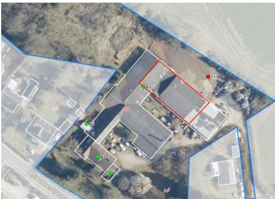
Placering af ny værksteds-/lagerbygning (vist med rød firkant)

Den nye bygning bliver ca. 26 m lang, 16 m bred og 5,5 m høj med 30 graders taghældning. Både tag og facader udføres med sorte metalplader.