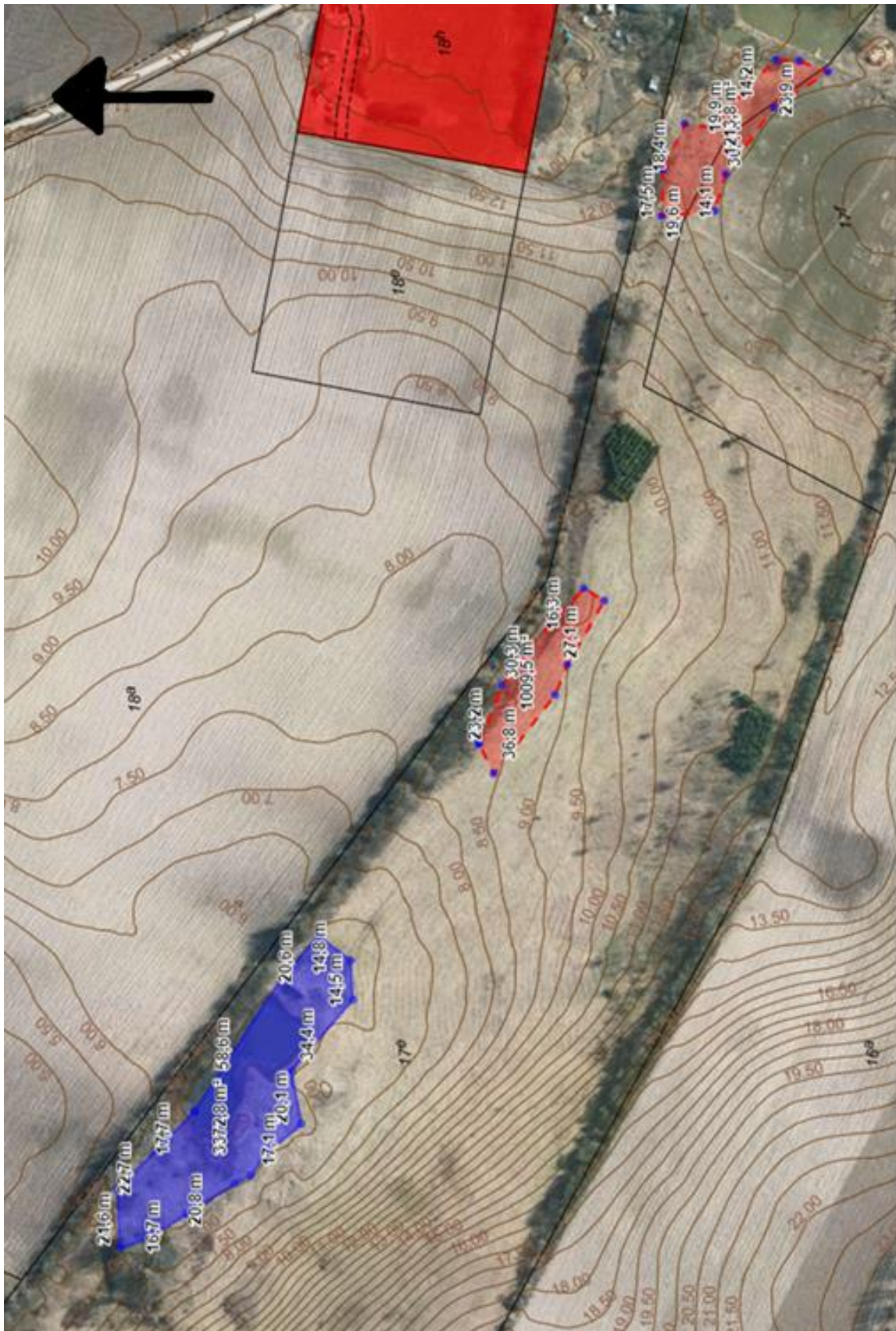
Figur 1 Afgrænsning af søer matr.nr. 17e og 17f, Lyø, Faaborg Jorder. Blå er den eksisterende sø med den ønskede udvidelse, de røde er nye søer.